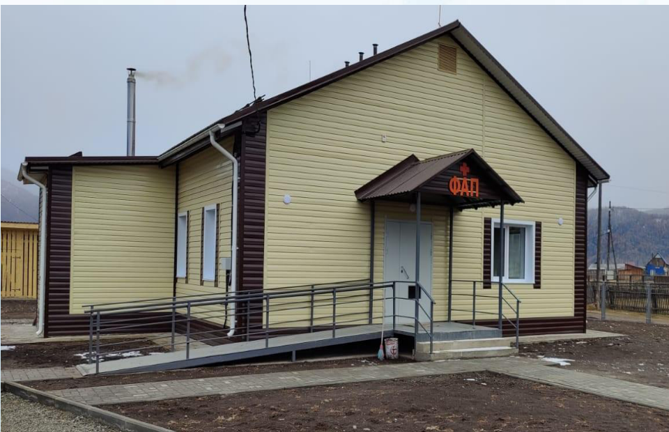
ФАП с.Верх-Уймон Усть-Коксинского района