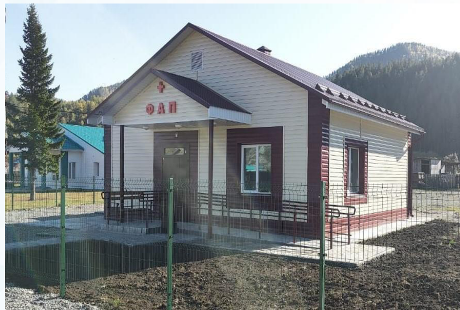
ФАП с.Анос Чемальского района