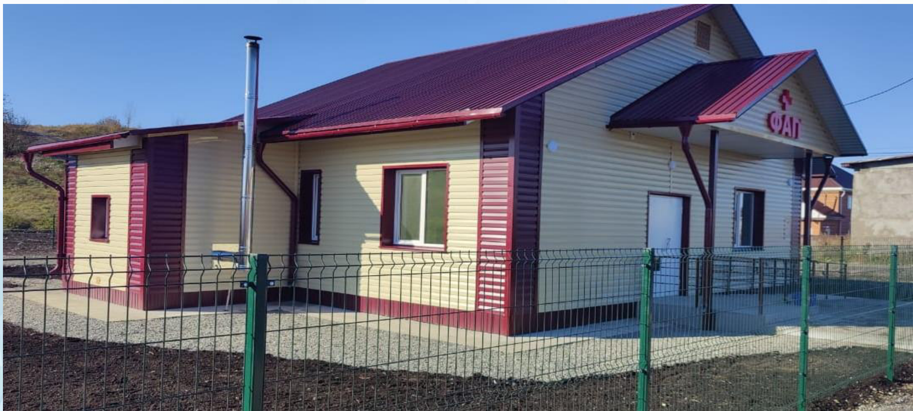
ФАП с. Карлушка Майминского района